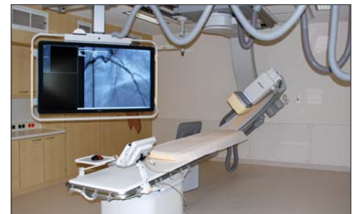
Einer der beiden Linksherzkathetermessplätze im internistischen Funktionsbereich

Die operative und die internistische Intensivstation, die weiterhin medizinisch und fachlich eigenständig geleitet werden, sind räumlich zu einer interdisziplinären Intensivstation zusammengefasst und auf insgesamt 26 Betten erweitert worden.